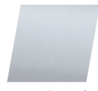
inox brossé brushed stainless steel